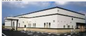
葬祭会館 葵 新築工事