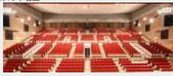
建築第002号 大崎市民会館椅子等改修工事