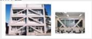
大崎市役所本庁舎 耐震補強工事