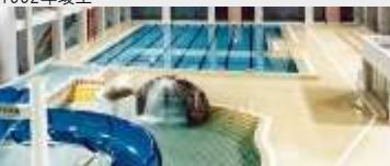
大崎市 (古川市) プール等 スポーツ施設新築工事 (JV)