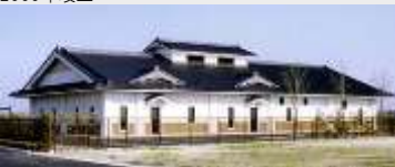
大崎市飯川地区 農集排1号処理場建設工事