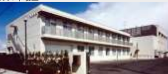
宮城県総合福祉センター新築工事