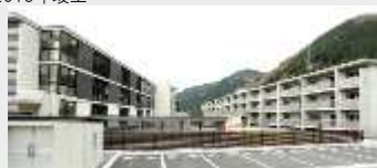
上鳴子住宅建替事業 住宅建設工事(JV)