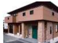
個人様邸宅 新築工事（設計・施工）