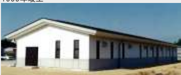
美里町南郷第一地区 (農集排) 処理施設建設工事