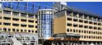
宮城県古川合同庁舎 新築工事 (JV)