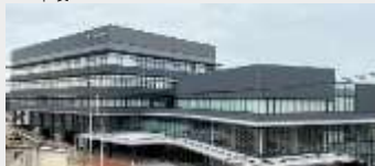
大崎市役所 本庁舎新築工事 (建築・JV)