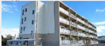
(仮称)岩出山下川原住宅建設工事 (建築)