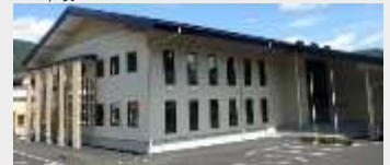
大崎市鳴子総合支所 複合施設 建設工事