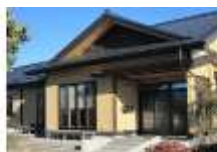
個人様邸宅 新築工事（設計・施工）