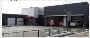
古川消防署田尻分署庁舎等 建設工事 (建築)