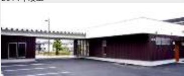
有限会社佐々木薬局 店舗新築工事（設計・施工）