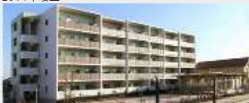
大崎市古川地域災害公営住宅整備事業 七日町住宅建設工事