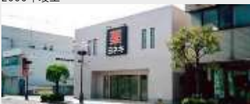
株式会社ヨネキ十字堂 十日町店改築工事（設計・施工）