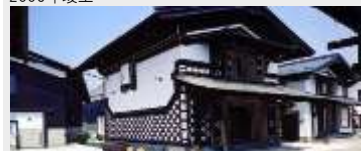
大崎市緒絶川周辺商業施設 醸室(かむろ)整備建設工事（JV）