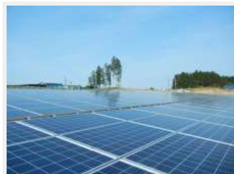
MC田尻太陽光発電施設