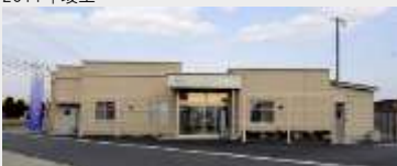
JA古川 通夜会館・斎場建設工事