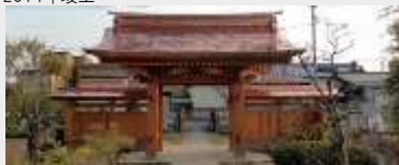
稲祝山富光寺 震災に伴う山門建替工事