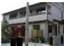
個人様邸宅 新築工事（設計・施工）