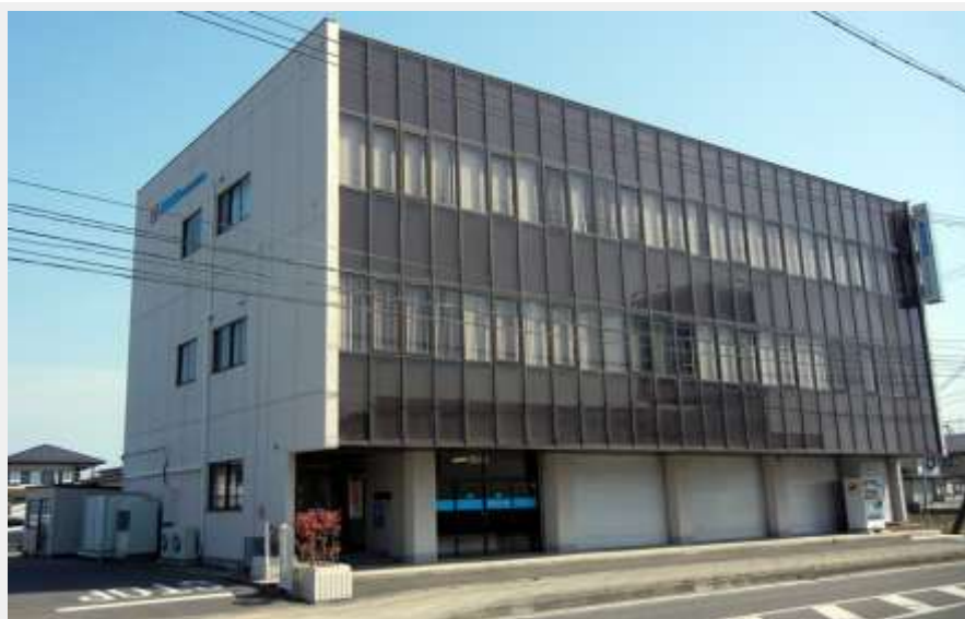
株式会社村田工務所 本社