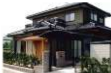
個人様邸宅 新築工事