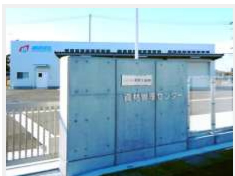
株式会社村田工務所 資材管理センター