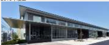
大崎市図書館等複合施設 建設工事 (建築・JV)