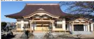
雲谷山龍洞院 本堂等新築工事