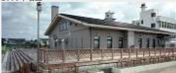
大崎市長古川配水場 建設工事