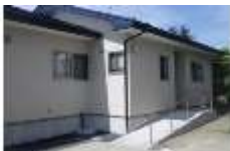
個人様邸宅 新築工事（設計・施工）